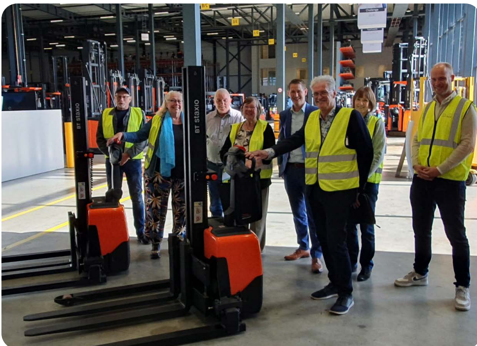
Vertegenwoordigers van Voedselbanken Land van Cuijk en Almelo hebben ieder een elektrische stapelaar in ontvangst genomen van Toyota Material Handling in Ede