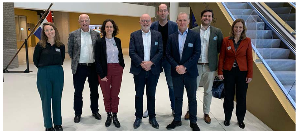
De vertegenwoordigers van de drie organisaties in het gebouw van de Tweede Kamer

voedselarmoede tegen te gaan. We hebben daarbij benadrukt dat wij geen verlengstuk van de overheid willen zijn. De aanpak zou dan onder meer het - door economen