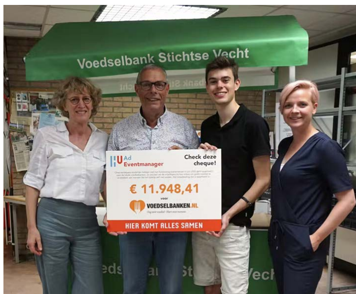
Bron: Vrijwilligers van de voedselbank, een student Ad eventmanager en een docent van de opleiding bij de uitreiking van de cheque in juli 2022.

Het kom-in-actie platform is een gratis online-pagina waarmee op een gemakkelijke manier geld kan worden ingezameld voor jouw lokale voedselbank. Al 58 van onze voedselbanken hebben momenteel een eigen Kom-in-Actie pagina. Afgelopen jaar is er ruim €190.000 opgehaald door de 58 voedselbanken die het platform gebruiken. Een geweldige prestatie in zo'n korte tijd!