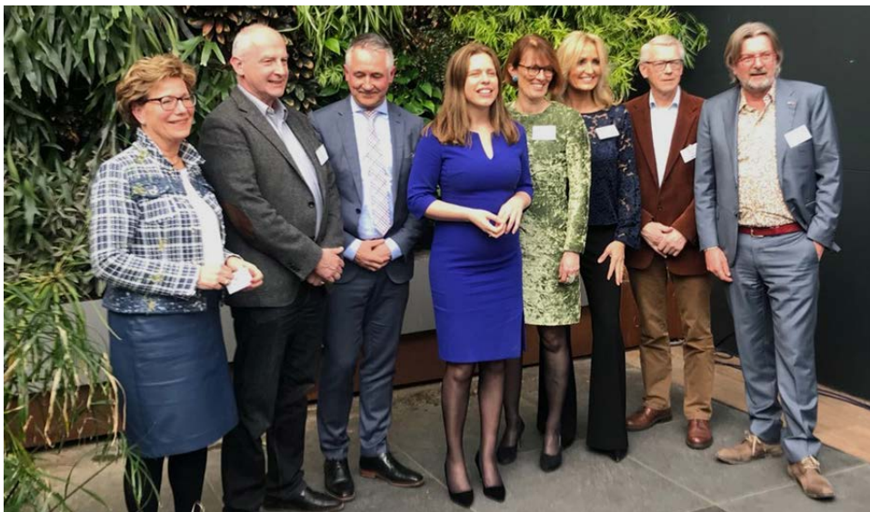
Kick off meeting in 2018 met Rob Baan en minister Carola Schouten, bron: Archief GFB 2018

Het programma start om 15.30u. Aanmelden kan tot 12 juni via de speciale jubileumwebsite: http://www.groentefruitbrigade.nl/jubileum/ Heb je vragen of opmerkingen, mail ons gerust, wij beantwoorden ze graag: communicatie@groentefruitbrigade.nl