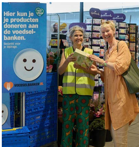
Vrijwilligers van Voedselbank Arnhem bij een filiaal van Albert Heijn

Daarnaast kon er statiegeld gedoneerd worden in de winkels voor de voedselbanken. Ook was het mogelijk te doneren via Airmiles of geld. Zo maken we het samen